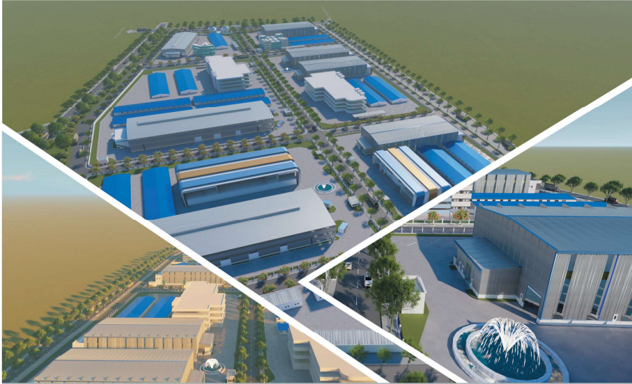
工业园区全景 (只有图像)